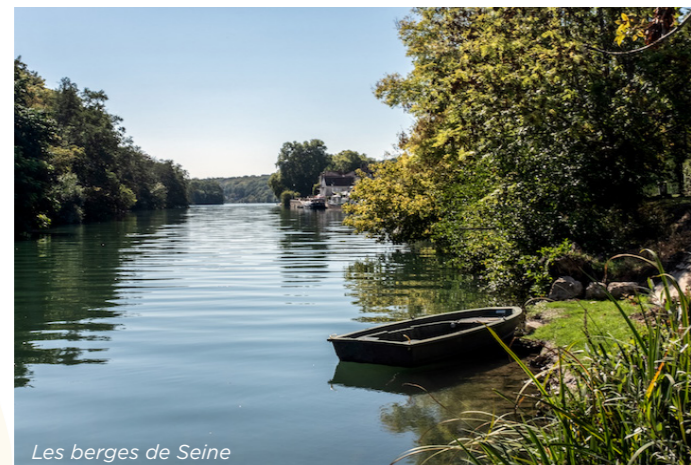
Les berges de Seine

Situé dans la Plaine Saint Jacques, le Clos du même nom propose un mode de vie "ville à la campagne" offrant tous les avantages de la vie de village avec ses marchés, ses commerces de proximité, son centre-ville atypique, son parc paysager, ses écoles et ses transports .