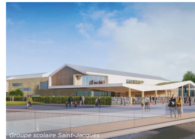
Groupe scolaire Saint-Jacques